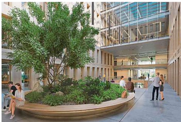
Kampus Albertov Studentům a pracovníkům by měl poskytnout moderní posluchárny a seminární místnosti, špičkově vybavené laboratoře, menzu, učebny, ale i místa pro společenská setkávání.

Investoři také počítají s využitím Národního plánu obnovy. Kvůli němu UK ještě nezačala s výběrem zhotovitele kampusu, kterého má podle harmonogramu stavby začít hledat do konce roku. „V současné době zatím ještě nebyl vyhlášen program financování z Národního plánu obnovy, předpokládané ter-