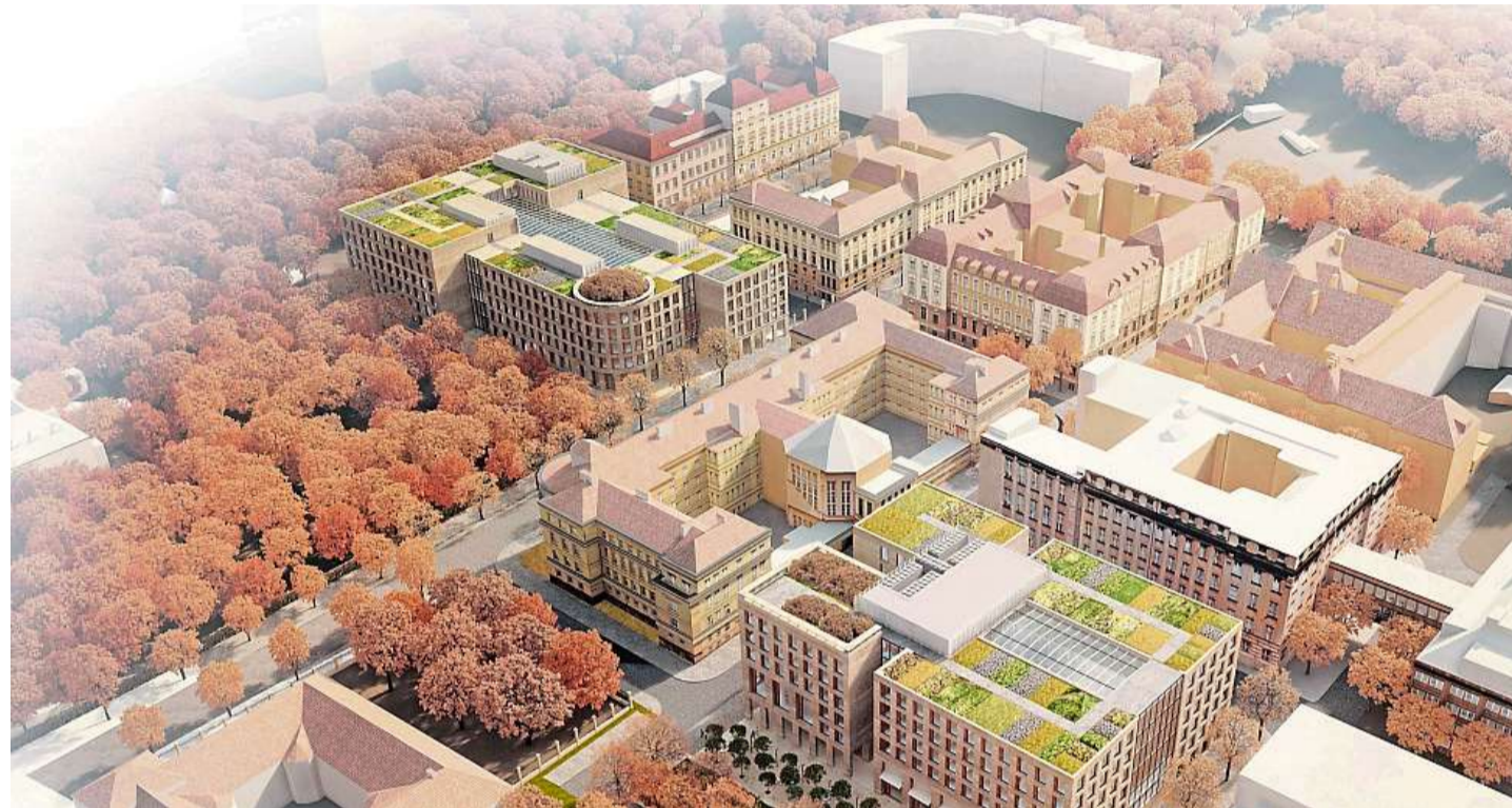
Nové univerzitní budovy Biocentrum i Globcentrum budou moderními budovami s plochou, zelenou střechou, které mají vzhledem zapadat do historické zástavby. Biocentrum je ve vizualizaci umístěné vlevo nahoře, Globcentrum se nachází vpravo dole. 2x vizualizace: Univerzita Karlova

S výstavbou druhého nového objektu, Globcentra, chce UK začít později. Teprve v září začne získávat stanoviska potřebná pro obdržení stavebního povolení. Výzkum Globcentra bude členěn do sedmi výzkumných směrů. Zahrnovat bude například Změny klimatu a atmosférické procesy či Geoinformatiku