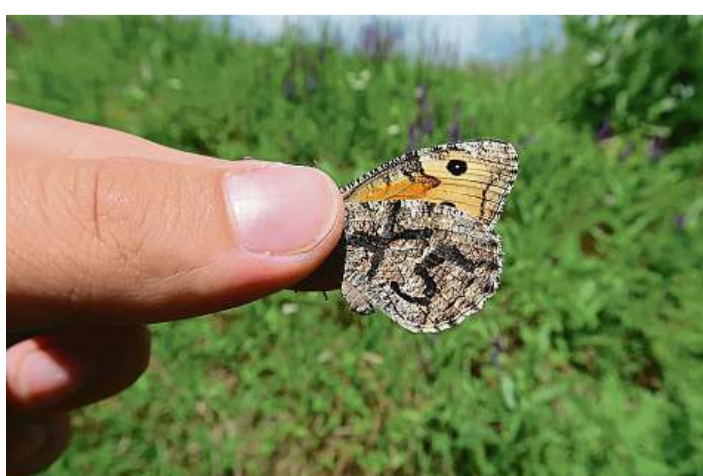
Výzkum V okolí Prokopského údolí se provádí výzkum populace a ekologie modráska vičencového a okáče metlicového.

„Neřešíme jen základní výzkum, ale pokoušíme se také rozšířit životní prostor pro vybrané druhy motýlů. Projekt nazvaný Cilená podpora